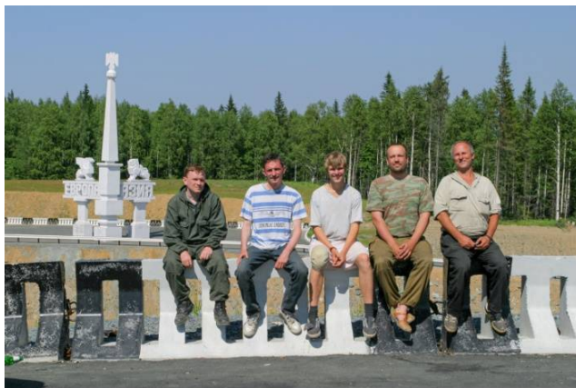
Кваркуш. 2004 год