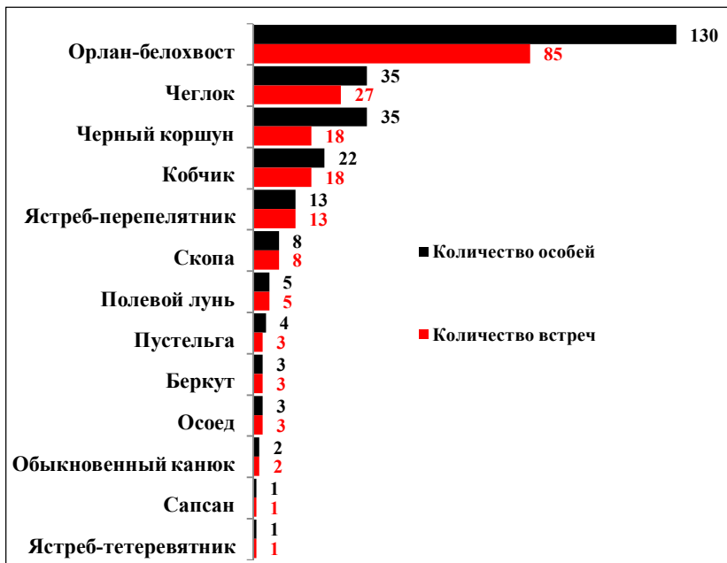
Рис. 1. Встречи соколообразных на территории ППКО

Результаты мониторинга сведены в базу данных (БД). Кроме собственных наблюдений, в БД вошли материалы сотрудников парка и сторонних организаций. Всего за период наблюдений было отмечено 22494 встречи птиц, которые относятся к 140 видам. На территории ППКО выявлено 13 видов дневных хищников и 6 сов (рис. 1–2).