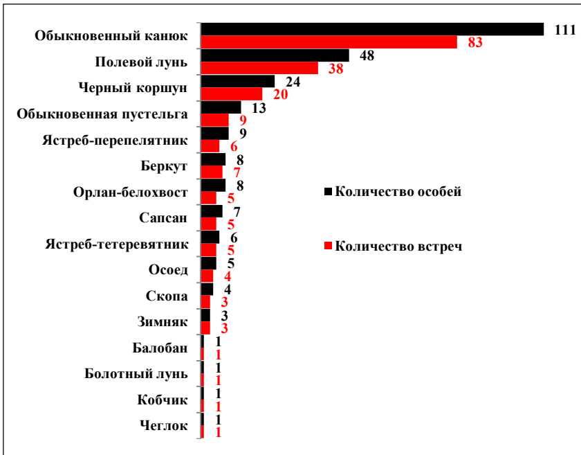
Рис. 3. Встречи соколообразных на территории ОПКВЗ

1995 г. сосна с гнездом упала. Впоследствии беркут на гнездовании не отмечен.